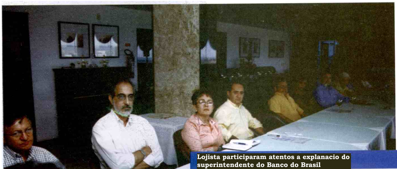
Lojista participaram atentos a explanacio do superintendente do Banco do Brasil